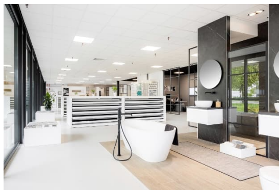
Impressies (alleen ter illustratie)