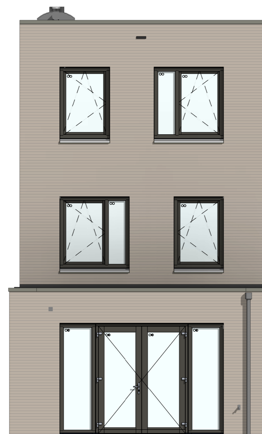
C-AB5424 - Aanbouw achtergevel, 2400mm C-AG5003 - Achtergevel voorzien van dubbele openslaande deuren en 2 zijzichten C-205007 - Buitenkraan in achtergevel