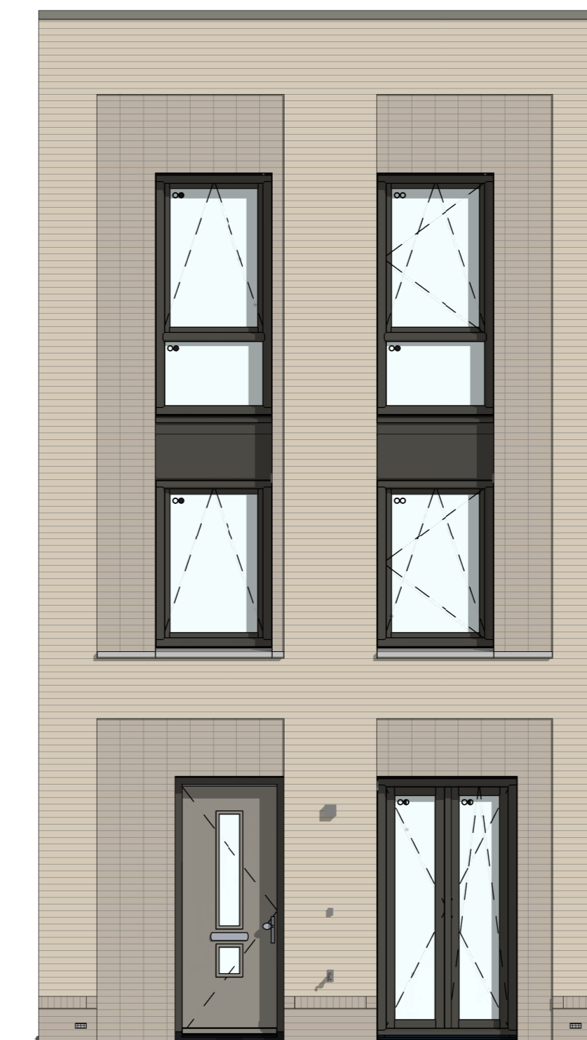
C-205000 - Buitenkraan in voorgevel C-PL0204PRE 2e verdieping met 2e badkamer aan de voorgevel