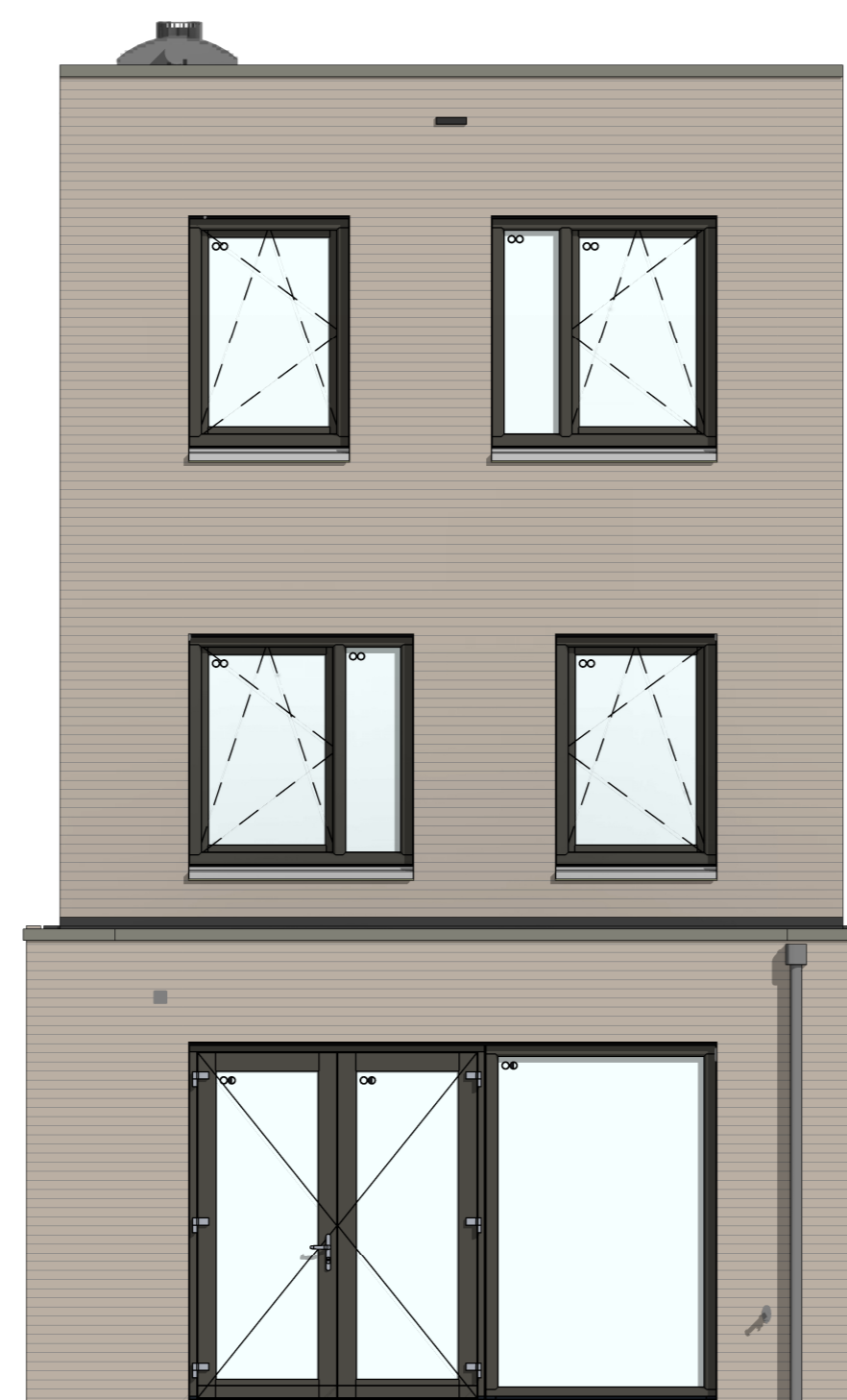
C-AB5412 - Aanbouw achtergevel, 1200mm C-AG5002 - Achtergevel voorzien van dubbele openslaande deuren en 1 zijzicht