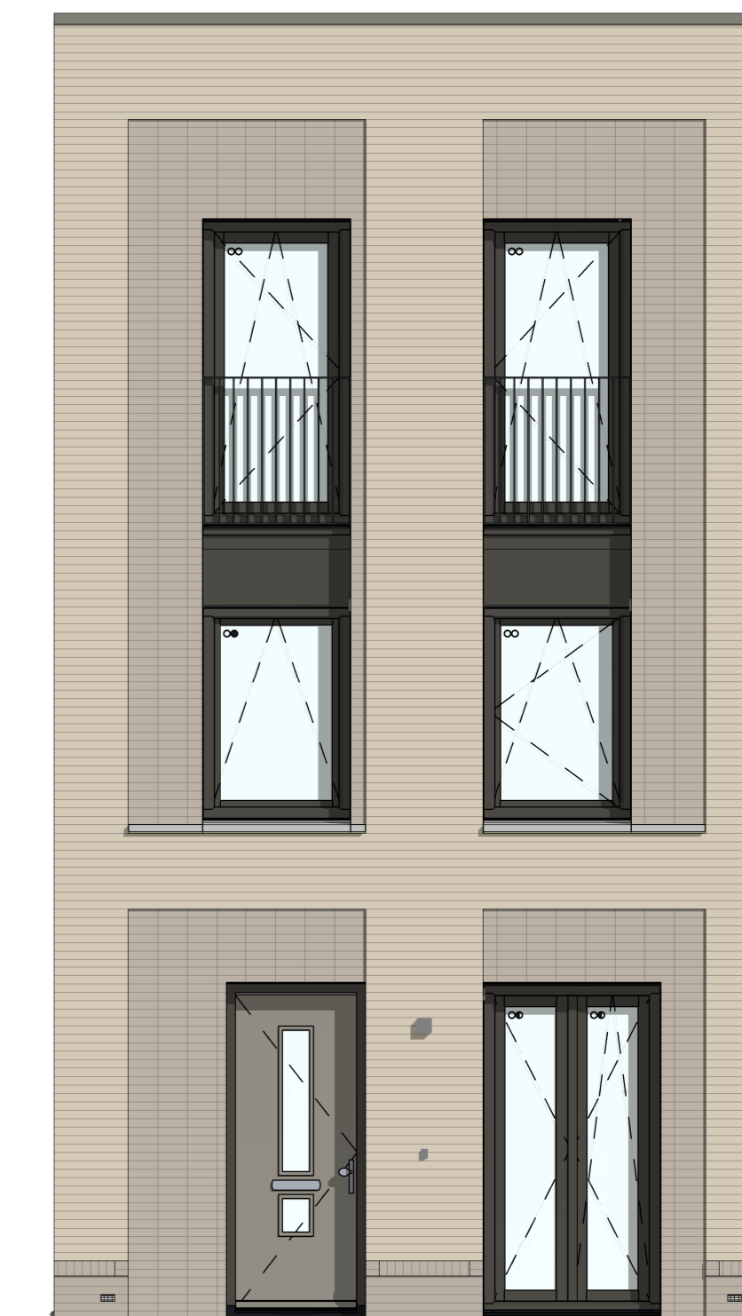
C-VGFB2001 Frans balkon t.p.v. kozijn op vloerniveau twee maal mogelijk ter plaatse van bouwnummer 15 en 16