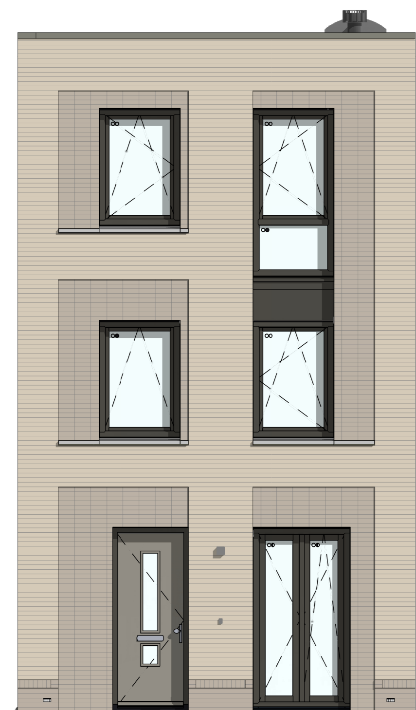
C-VG5001 - Voorgevel in basis uitvoering