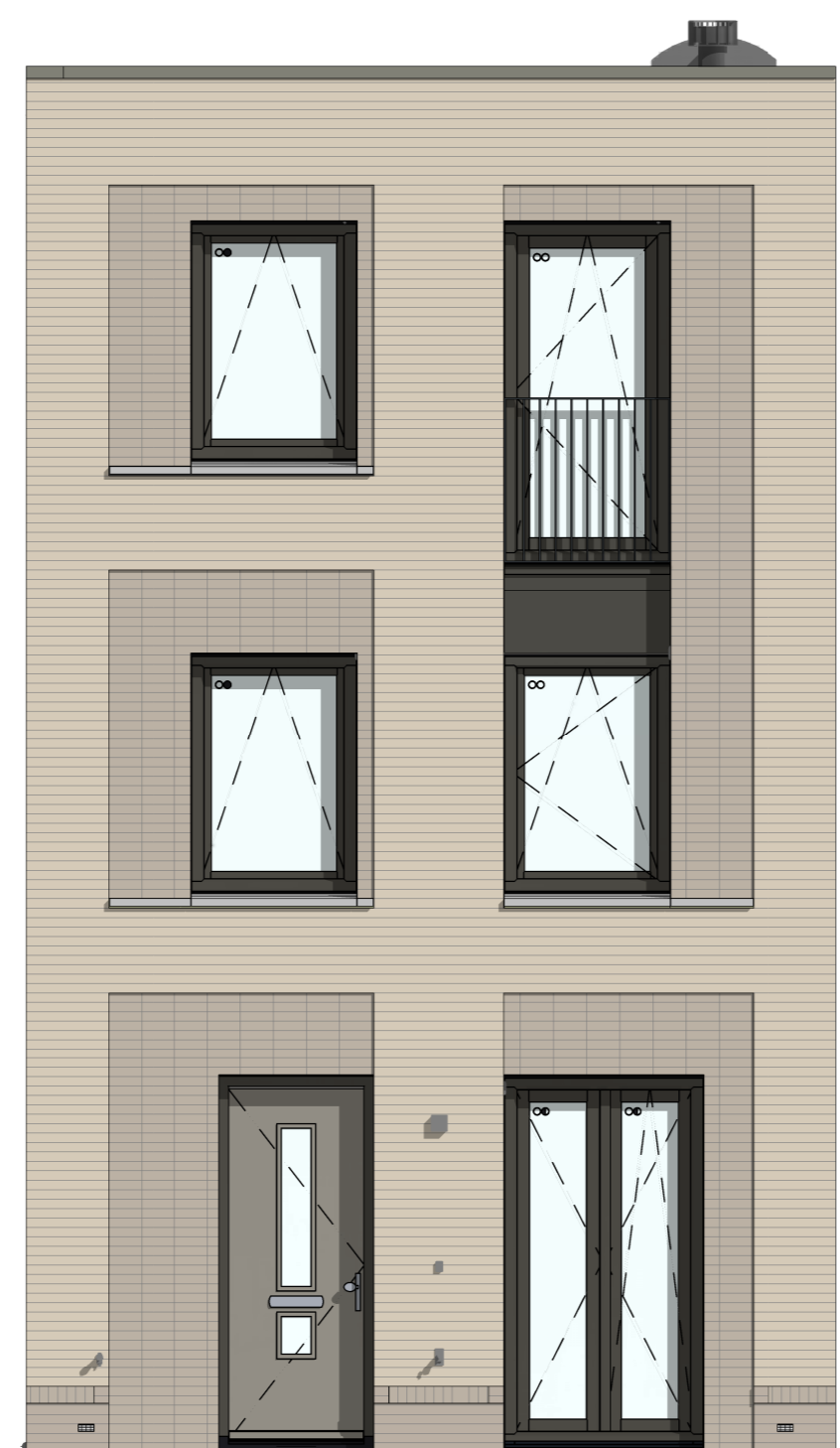
C-205000 - Buitenkraan in voorgevel C-VGFB2001 Frans balkon t.p.v. kozijn op vloerniveau C-PL0204PRE 2e verdieping met 2e badkamer aan de voorgevel