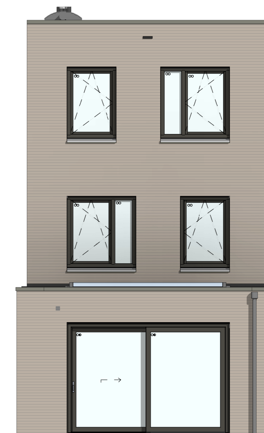
C-AB5424 - Aanbouw achtergevel, 2400mm C-AG5004 - Achtergevel voorzien van schuifpui C-LS5424 - Lichtstraat lengte circa 3.300mm x 1.000mm in achteruitbouw (alleen mogelijk i.c.m. optie AB5424)